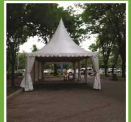
Tenda Sarnavil Uk. 5 x 5 M

SEKRETARIAT DIKOMPLEK STADION CP: RAIS (0822 4670 4370) KHALIL (0852 9652 3226) RUDI (0852 7762 3307)