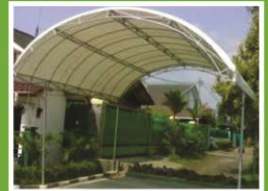
Tenda Kanopi Uk. 5 x 4 M